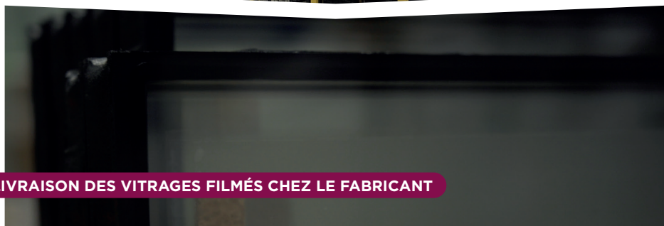
LIVRAISON DES VITRAGES FILMÉS CHEZ LE FABRICANT