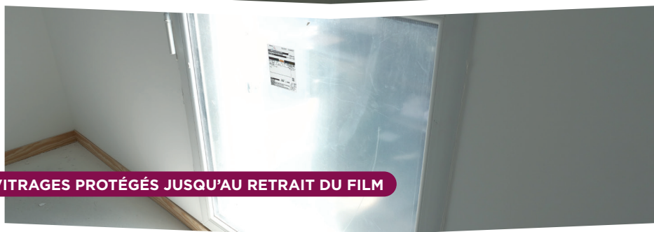
VITRAGES PROTÉGÉS JUSQU'AU RETRAIT DU FILM