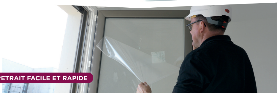
RETRAIT FACILE ET RAPIDE